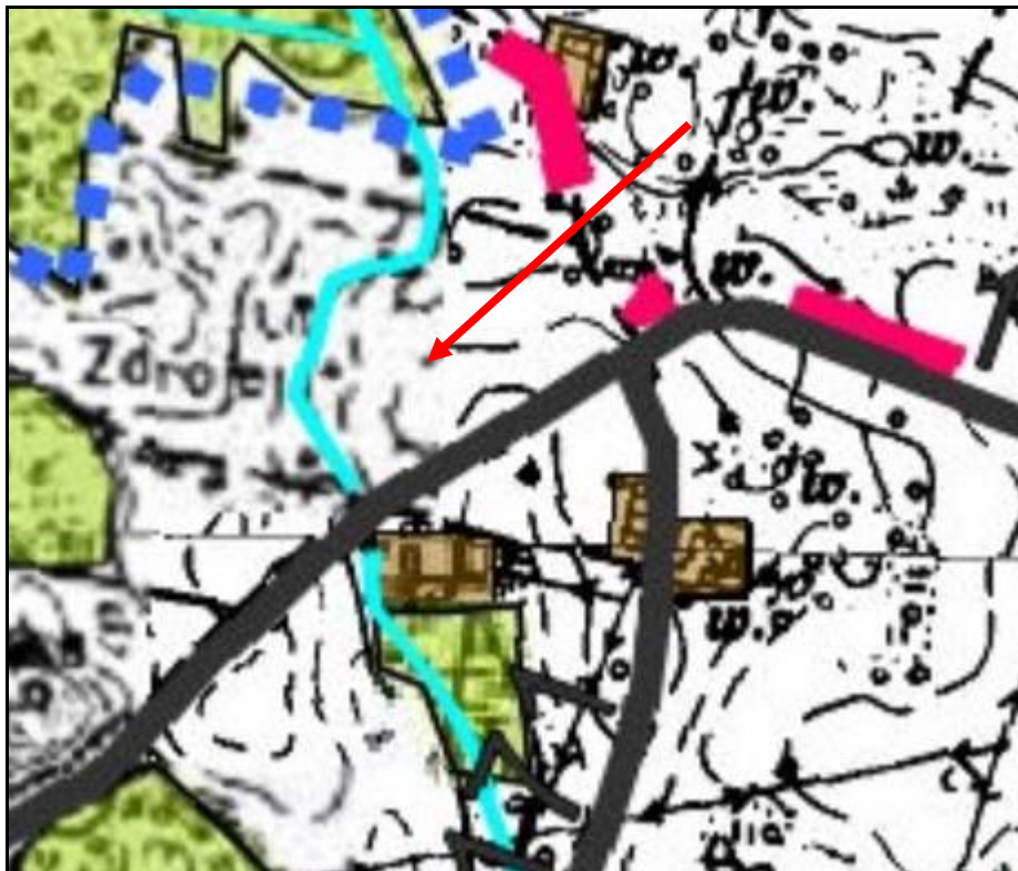
Widok na fragment graficzny ze Studium Uchwała nr VII/43/03 tereny rolne