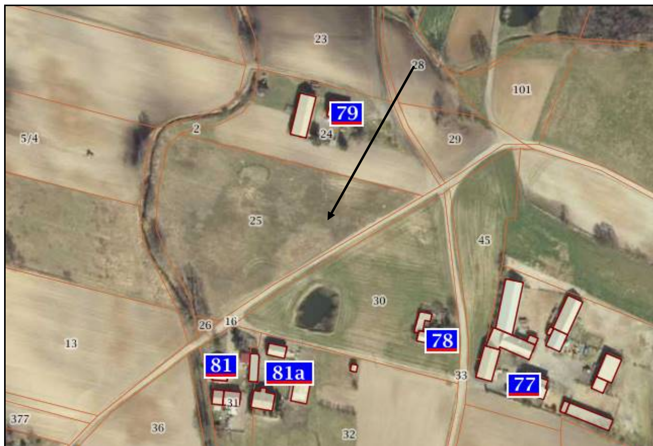
Widok satelitarny na działkę nr 25

Działka o numerze ewidencyjnym 25 o powierzchni: 0,8300 ha położona jest w miejscowości Łochocin, gmina Lipno, powiat lipnowski. Kształt działki to wielobok - nieutrudniający zagospodarowania. Teren działki płaski, bez znacznych deniwelacji gruntu. Działka jest nieogrodzona, niezagospodarowana, porośnięta roślinnością niską oraz zakrzaczenia i zadrzewienia – samosiejki drzew. Nieruchomość na dzień wyceny niewykorzystywana. Według zapisów Studium działka położona na terenach rolnej z potencjalną możliwością zabudowy. Dostęp do działki na dzień wyceny możliwy bezpośrednio z drogi dojazdowej o nawierzchni nieutwardzonej. Lokalizacja średnia, dostępność komunikacyjna średnia.