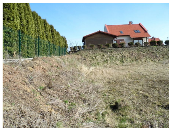
północna część działki