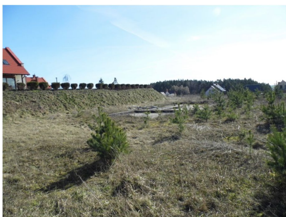
widok na działkę z jej płn.-zach. narożnika