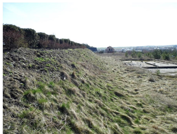
wschodnia część działki