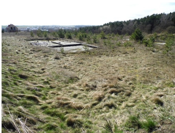
widok na działkę z jej płn.-wsch. narożnika