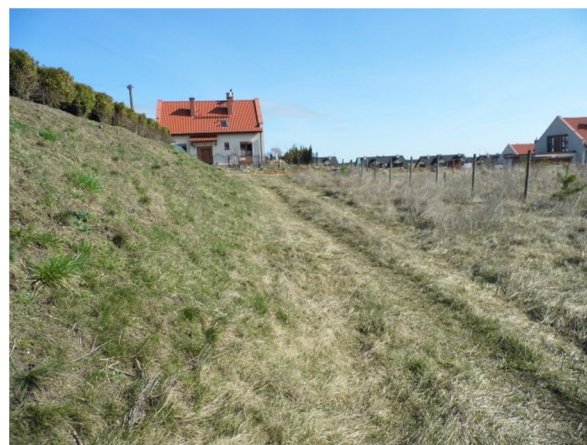
nieurządzona droga gruntowa po stronie południowej