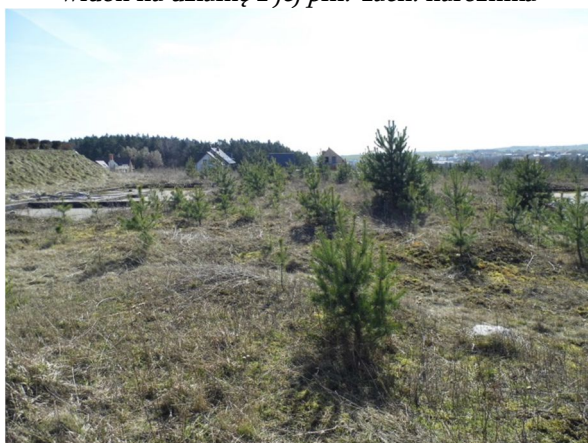
zachodnia część działki