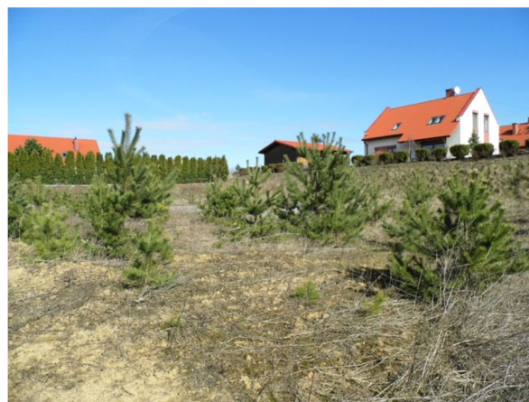
widok na działkę z jej płd.-zach. narożnika