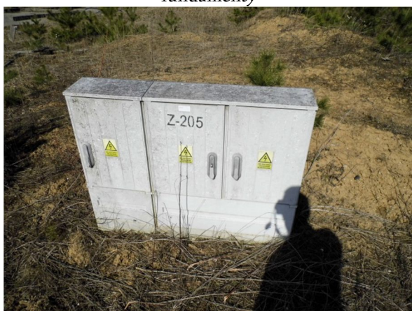
skrzynka elektryczna w płd.-zach. narożniku