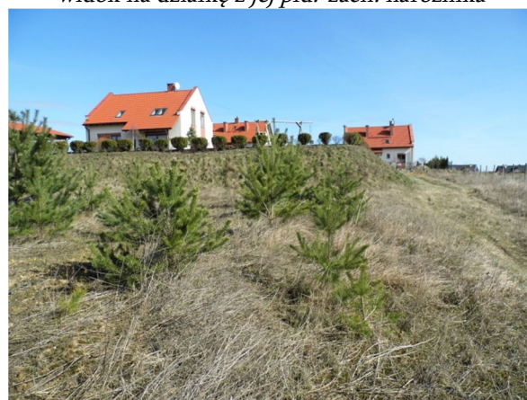
południowa część działki