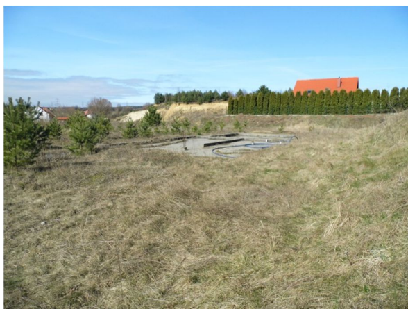
widok na działkę z jej płd.-wsch. narożnika