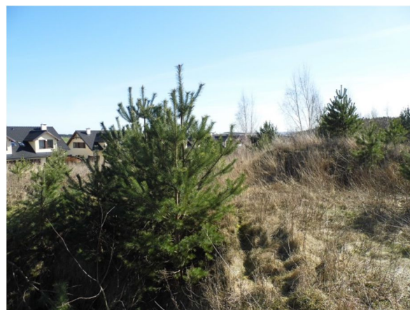
widok na działkę z jej półn.-zach. narożnika