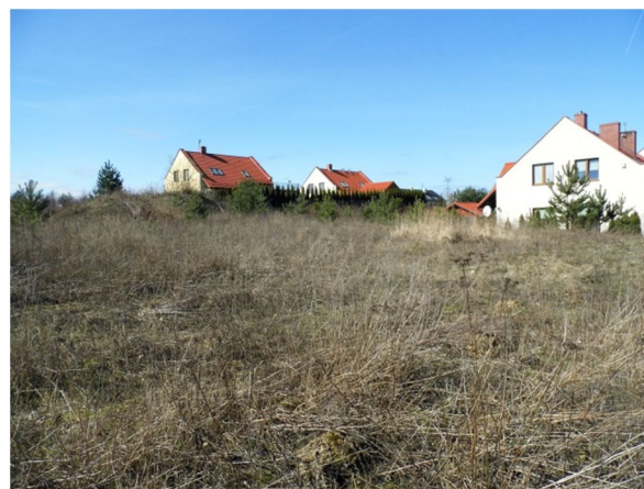
widok na działkę z jej płd.-wsch. narożnika