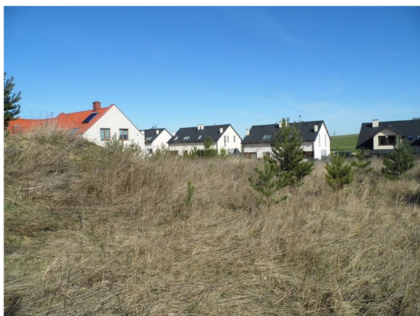
widok na działkę z jej płd.-zach. narożnika

Poniżej przedstawiono dokumentację fotograficzną przedmiotowej nieruchomości wykonaną w dniu oględzin, tj. 22.03.2019 r.: