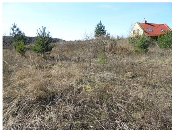
zachodnia część działki