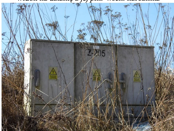
skrzynka elektryczna w płd.-wsch. narożniku