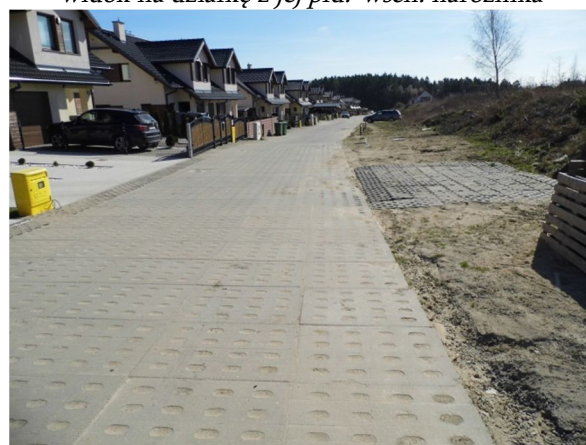
ul. Malczewskiego po stronie wschodniej działki