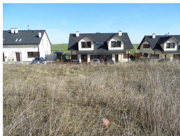
wschodnia część działki