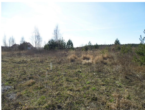
widok na działkę z jej półn.-wsch. narożnika