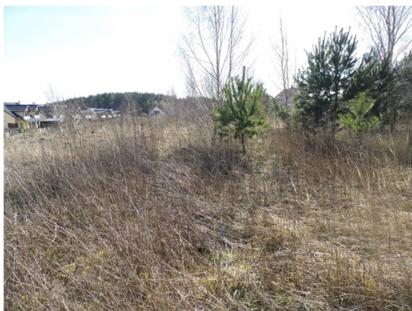
południowa część działki