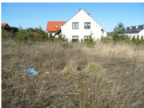
południowa część działki